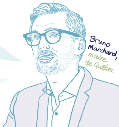
Bruno Marchand, maire de Québec

Un MAIRE , c'est juste un RECYCLEUR avec une VISION